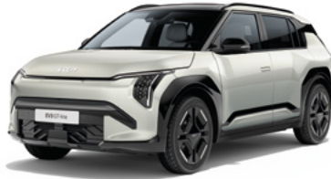
Ivory Silber Met. (ISG)