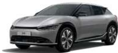
Steel Gray (KLG) 2