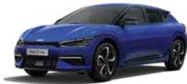
Yacht Blue (DU3) *2