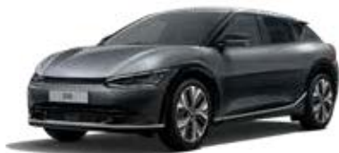
Interstellar Gray (AGT) 2