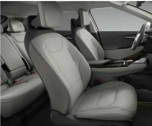
EV6 Air Plus CVH - Grau/Schwarz Sitze aus veganem Leder