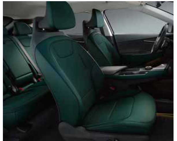
EV6 Air Plus CGP - Dunkelgrün/Schwarz Sitze aus veganem Leder