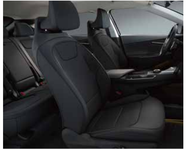
EV6 Air Plus WK - Schwarz Sitze aus veganem Leder