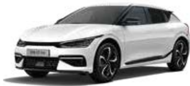
Snow White Pearl (SWP) 3