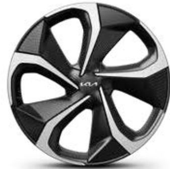
EV6 GT-line Leichtmetallfelgen 20 Zoll mit 255/45 R20 Bereifung