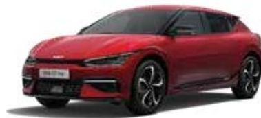
Runway Red (CR5) 2