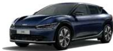
Gravity Blue (B4U) 2