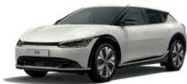
Glacier (GLB) 2