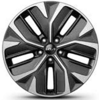
EV6 Air Leichtmetallfelgen 19 Zoll mit 235/55 R19 Bereifung