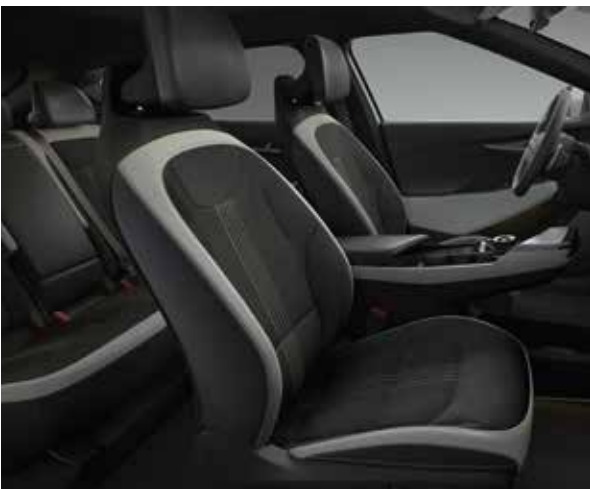
GT-line WK - Schwarz/Weiß Veloursledersitze mit Applikationen aus veganem Leder