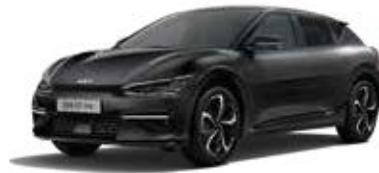
Aurora Black (ABP) 3